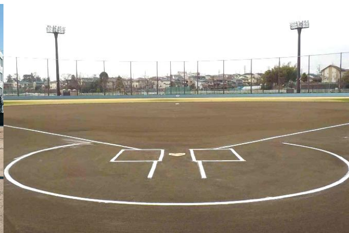
瀬谷本郷球場(瀬谷区)