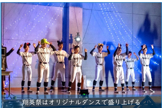
翔英祭はオリジナルダンスで盛り上げる