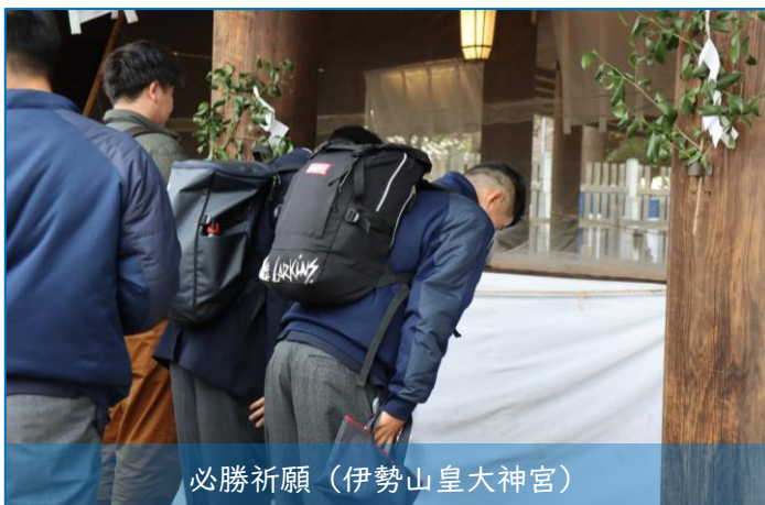
必勝祈願（伊勢山皇大神宮）