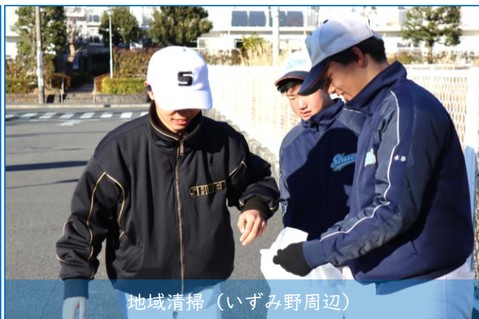
地域清掃（いずみ野周辺）