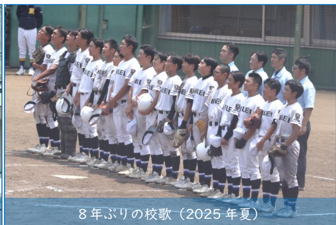
8年ぶりの校歌（2025年夏）