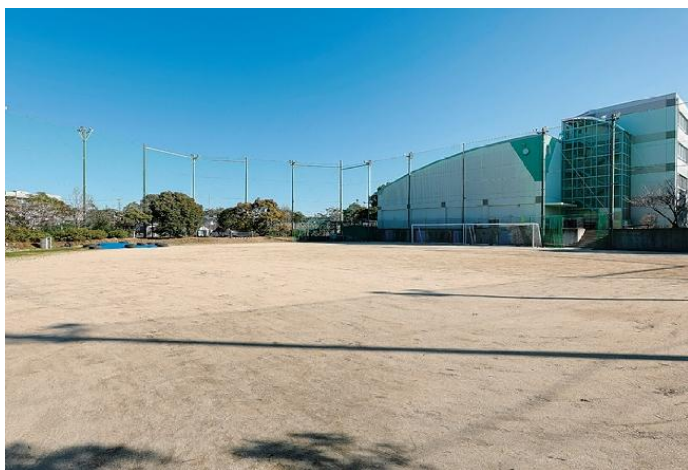
秀英高校グラウンド(泉区)