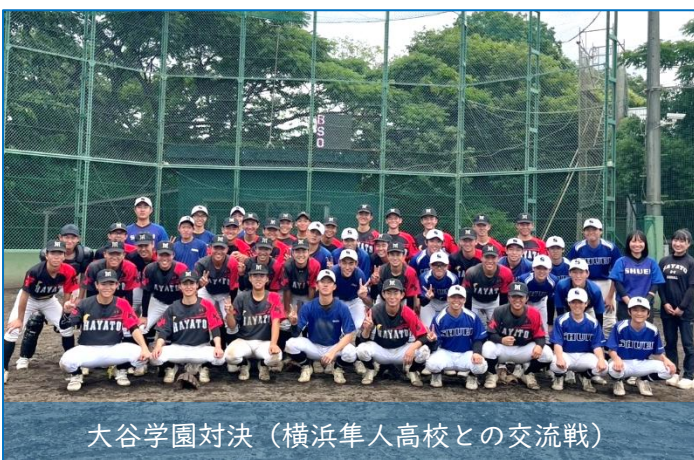
大谷学園対決（横浜隼人高校との交流戦）