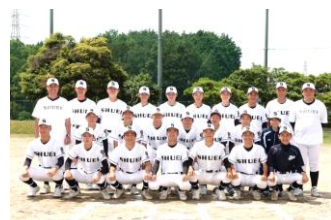
新体制で迎えた初めての夏(2024)