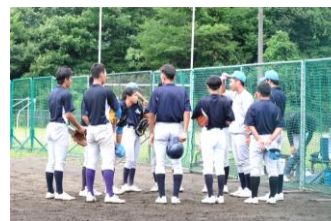
新チーム初の対外試合(2023)